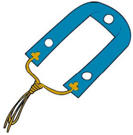
ご法事には 「門徒式章」着用

*土曜・休日にご法事をご希望の方は、特に 早め（二〜三ヶ月前）にご連絡をお願い致 します。 *「永代過去帳」（上写真）をお持ちの方は、 年が変わったら、年号（令和五年）を書 き加えましょう。 *仏事のことでは不明のことがあれば、遠慮な くご相談下さい。